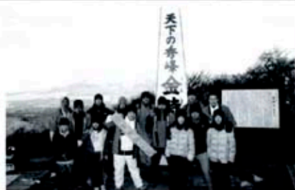
天気にも恵まれ、寒い中良い汗を流し、子供たちや青年部員にとっても有意義な一日となりました。また、参加者にとっても今年の良い一年になるのではないのでしょうか。

金時山には雪がうっすら積もっており、足を滑らして転ぶ人や雪を楽しむ子供たちで山道は賑わっていました。頂上ではバツジ配布の補助や写真撮影などを行いました。今年の空は晴れ渡って空も澄んでおり、無事ご来光を迎える事ができました。